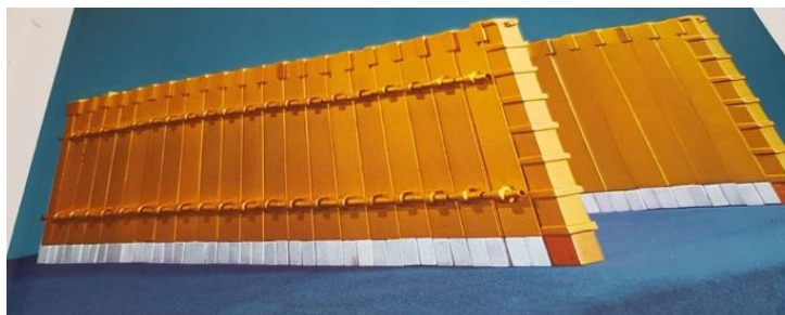
De balken met zilveren fundering

Tenslotte wordt MERARI, de jongste zoon en zijn gezin, geteld. Het Merari-gezin was verantwoordelijk voor het transport van de pilaren, de balken en de zilveren funderingsstukken.