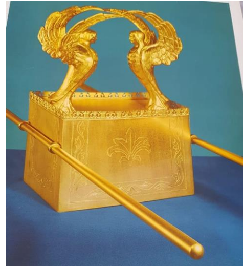
De heilige ark.

Voor we hier antwoord op geven verdiepen we ons eerst in enkele technische details: Hoewel alles in de Tempel heilig was, was er toch een verschil tussen verschillende onderdelen. De meest heilige voorwerpen moesten namelijk tijdens de hele reis met de hand gedragen worden. De andere voorwerpen mochten op wagens vervoerd worden. Vandaar dat KEHAT, hoewel hij de middelste zoon was, voorrang kreeg boven zijn oudere broer. Hij was namelijk fysiek sterker. KEHAT nam de heilige ark mee waar de stenen tafelen in lagen. Zijn mannen waren gespierd en konden het zware werk verrichten. Zij waren sterk genoeg om alles met de hand, zonder wagens, te transporteren.