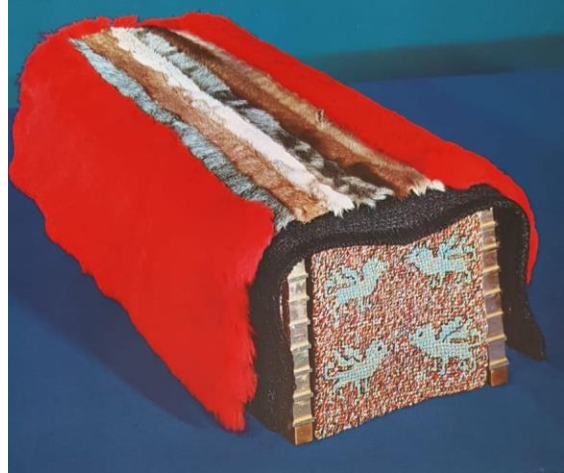
De doeken.

GERSHON, de oudste zoon, heeft een minder zware taak. Hij hoeft de doeken en gordijnen onderweg niet te dragen. Daar zijn de wagens voor. Toch is enige spierkracht vereist. Hij moet over muren klimmen om de grote doeken te verwijderen. Behalve dat moest hij toch een heel stuk lopen met de zware stoffen alvorens hij bij de wagens kon komen. Hoe weten wij dat? Omdat de wagens vijf amot breed waren. De afstand tussen de pilaren van de tabernakel was minder dan 5 amot . Hierdoor kunnen we concluderen dat het onmogelijk was om met de de wagens naar binnen te rijden. De familie Gershon moest daarom de voorwerpen die zij transporteerde, eerst naar buiten dragen totdat zij bij de wagens kon komen.