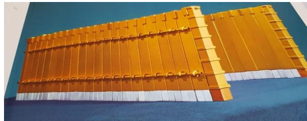
De balken met zilveren fundering

Deze week lezen en bestuderen wij Parashat Naso. Nu beginnen we met de familie Gershon, de oudste zoon van Levi. Ook zijn familie wordt geteld en mag meedoen met het Levi transportbedrijf, gespecialiseerd in heilige en kostbare goederen. De Gershon-familie nam de gigantische grote stoffen bekledingen mee die over het heiligdom hingen, alsmede de lange gordijnen die tussen de verschillende delen van het tabernakel hingen.